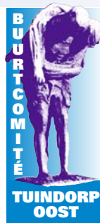
BUURTCOMITÉ TUINDORP OOST