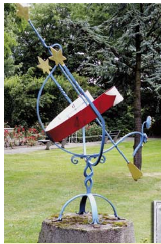
• "Zonnewijzer" geplaatst door de familie Blom-Visser ter ere van hun 50-jarig huwelijk. De zonnewijzer is gemaakt door Harry de Groot.

werk gevraagd waarin het dynamische karakter van het leven van de bewoners tot uitdrukking zou komen. Ik heb toen gekozen voor een geestelijke dynamiek, die ik vormgegeven heb in een waaivormige uitstraling. De figuur in het ontwerp is vol levenslust en energie en