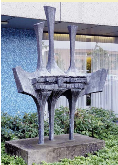
• "Samen sterk", gemaakt in 1984 door Rien Goenée. Dit beeld is gemaakt ter ere van het derde lustrum van Tuindorp Oost.

Het is een in brons gegoten beeld. De kunstenaar is geïnspireerd door de gedachte, dat in het gebouw één be-