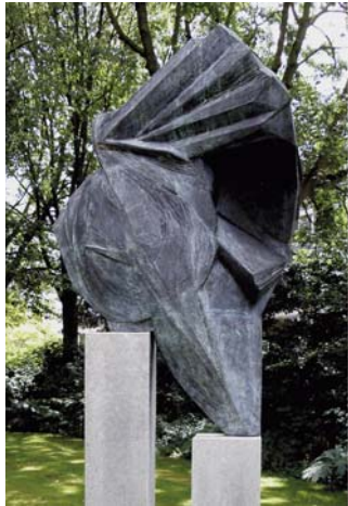
• "Ondersteunende dynamiek" van Moniek Bastiaanse.

Moniek Bastiaanse geeft de volgende uitleg aan het beeld: "Er werd een kunst-