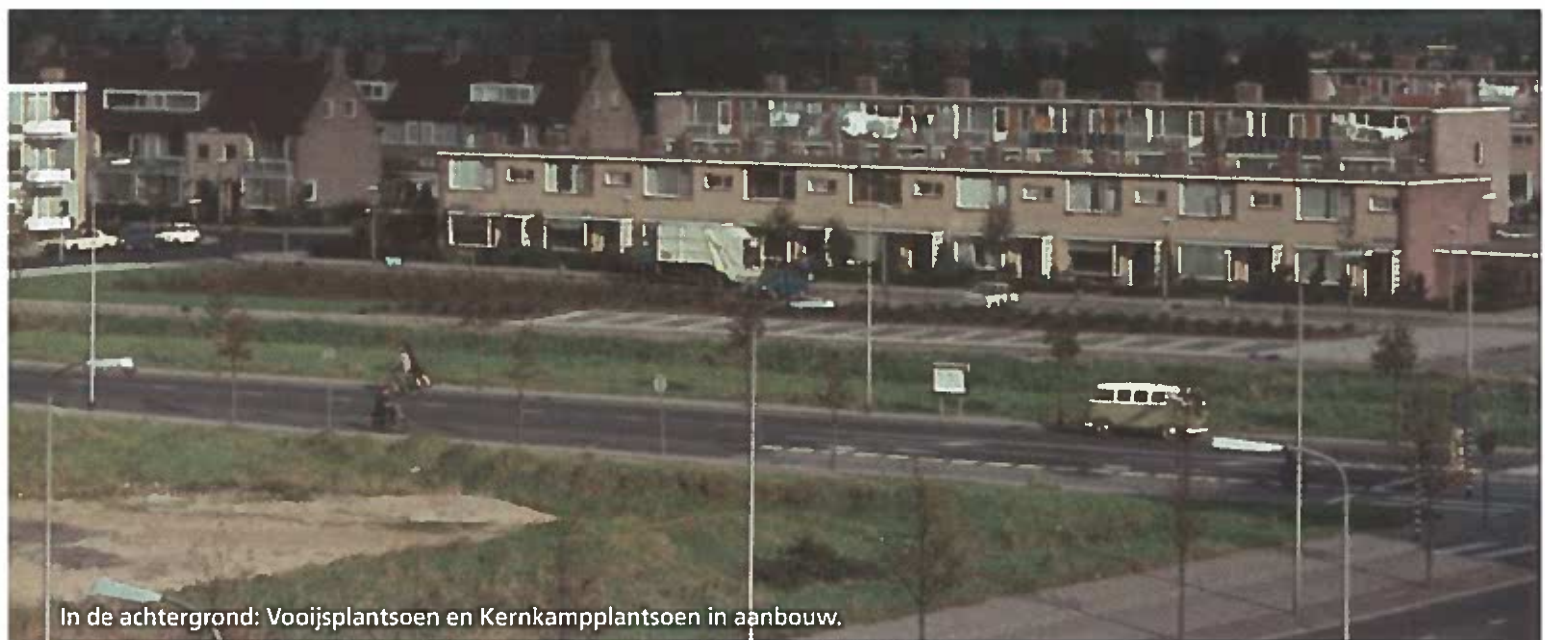
In de achtergrond: Vooijsplantsoen en Kernkamplantsoen in aanbouw.