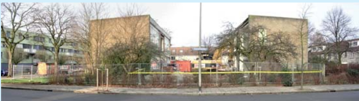
Mr. J.J.L. van de Bruggenschool

Tot de eeuwwisseling stonden er aan de westkant van de Eykmanlaan geen huizen en bestond er geen Professor Zonnebloemhof/Zonnebloemlaan. Op het terrein stonden twee scholen. De R.K. U.L.O. , later omgedoopt tot St. Gerardus Majella mavo met de ingang aan de Winklerlaan 370-372. Er pal naast, met de ingang op de Eykmanlaan 80, stond de J.P.Thijsseschool voor mavo. Op het terrein van de Cohenlaan – Van Herwerdenlaan, dat jarenlang een fijn speelveld was en waarop nu woningen zijn gebouwd, stond de Mr. J.J.L. van de Bruggenschool voor basisonderwijs.