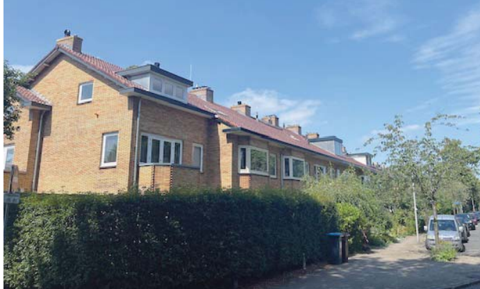
De huizen in de J.P.Thijsselaan.

In onze omgeving zijn al voorbeelden te zien. De transitie van de 87 Vesteda woningen (J.P. Thijsselaan in Tuindorp) loopt bijna een jaar. En binnenkort worden de 120 Amvest woningen (Eyckmanlaan) aangepakt. Alleen: als je, uitgaande van 200 werkdagen per jaar, berekent hoeveel woningen per dag dit zijn, kom je bij het eerste project op 0,4 woning en bij het tweede op 0,6. Als ze parallel gepland zouden zijn, kom