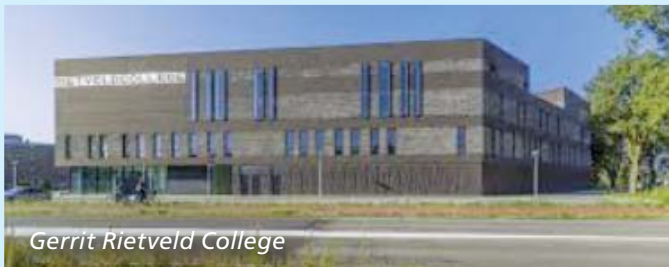
Gerrit Rietveld College

Het Gerrit Rietveld College is gevestigd aan de Eykmanlaan en biedt als onderwijs mavo, havo, vwo atheneum en vwo gymnasium aan. Uniek is dat zij ook een technasium aanbiedt waar de leerlingen onderwijs krijgen op het gebied van techniek en technologie. Het Gerrit Rietveld College is in 2005 ontstaan uit de fusie van College de Klop en College Blaucapel. Het huidige gebouw is in april 2015 geopend.