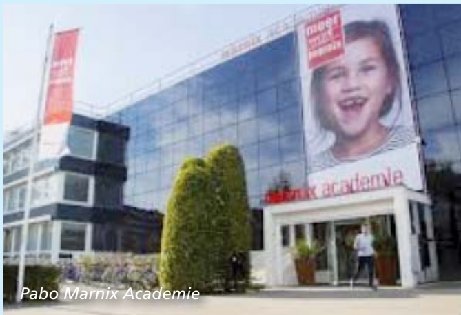
Pabo Marnix Academie

Het Gerrit Rietveld College is gevestigd aan de Eykmanlaan en biedt als onderwijs mavo, havo, vwo atheneum en vwo gymnasium aan. Uniek is dat zij ook een technasium aanbiedt waar de leerlingen onderwijs krijgen op het gebied van techniek en technologie. Het Gerrit Rietveld College is in 2005 ontstaan uit de fusie van College de Klop en College Blaucapel. Het huidige gebouw is in april 2015 geopend.