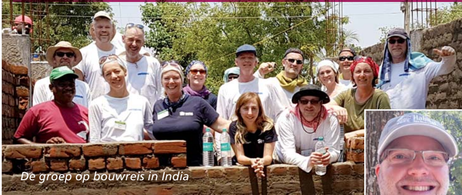
De groep op bouwreis in India