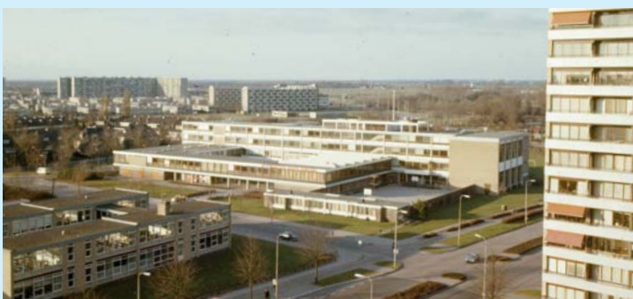
Rechts college Blaucapel, links Majella mavo - J.C. Janssen, fotograaf

Soms lijkt een school verdwenen, maar als je door fusies, naamsverandering en (ver)nieuwbouw heen kijkt, bestaat de school nog steeds. Denk maar aan college Blaucapel: dat gaat alweer enige tijd als Gerard Rietveld College door het leven. SO Fier heette vroeger Dr. de Pels School en in een deel van de gebouwen waarin Nimeto gevestigd is, was vroeger de slagersvakschool te vinden.