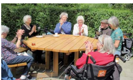
De picknicktafel in gebruik