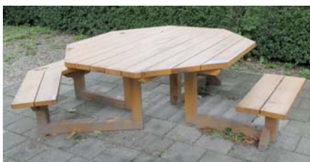
Picknicktafel in volle glorie